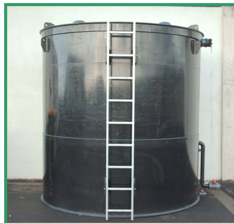
Présentation de l'Unité Compacte de Traitement ®

Le principe de l'Unité Compacte de Traitement consiste à traiter l'effluent par filtration/décantation. L'UMCT assure un traitement sur site des effluents issus de l'activité de carénage.