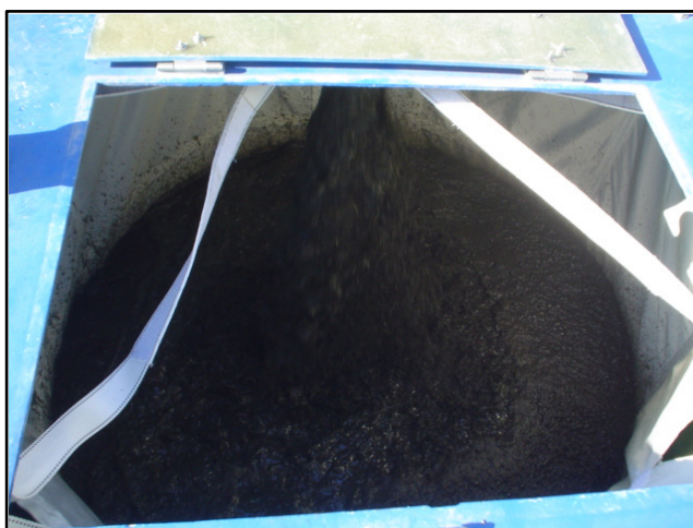
Photo : Sac filtrant rempli de boues de carénage toxiques.